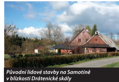
Původní lidové stavby na Samotíně v blízkosti Drátenické skály

umělecké inspirace. Čerpali z něj např. spisovatelé Tereza Nováková, Josef Věromír Pleva, Jan Karafiát, Alois a Vilém Mrštíkové, hudební skladatelé Jaroslav Křička, Bohuslav Martinů, malíři Antonín Slavíček, Jan Zrzavý, Josef Jambor i současní umělci. S poslední vlnou kolonizace krajiny v 18. století je spjat vznik nejmalebnějších osad a vesnic, jako Blatiny, Samotín či Krátká,