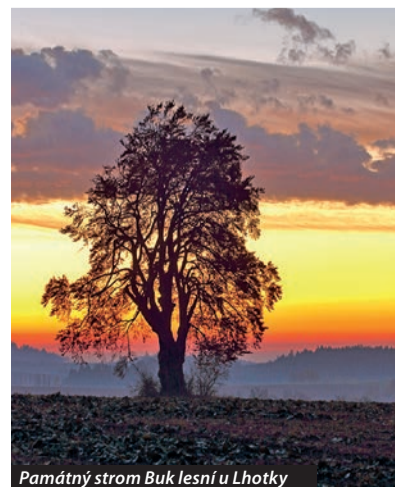
Památný strom Buk lesní u Lhotky

Dramatickým vývojem dospěla krajina Žďárských vrchů ke tvárnosti, kterou pocítujeme jako malebnou a útulnou. Poeticky drsný ráz krajiny je i neustálým zdrojem