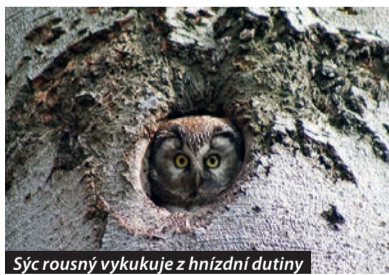
Sýc rousný vykukuje z hnízdní dutiny

Vzácné rostliny a živočichové mají zvláštní nároky na prostředí. Správa CHKO zajiš-