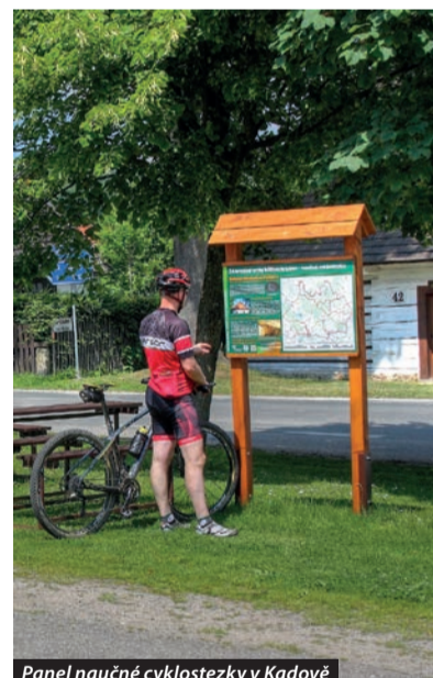
Panel naučné cyklostezky v Kadově

Tady nejste ani na západě, ani na východě, tady jste uprostřed. Malebná krajina a přírodní podmínky v pomyslném středu republiky lákají k celoroční rekreaci a odpočinku. Nejhodnotnějšími přírodními krásami provází naučné stezky Dářská rašeliniště a Žákova hora. Na své si přijdou milovníci cykloturistiky od náročných sportovců po rodiny s dětmi, inspiraci pro výlet lze nalézt v průvodci naučnou cyklostezkou „Žďárskými vrchy křížem krážem“. Rulové skalní útvary jako Devět skal, Čtyři palice či Drátenická skála jsou lákadlem pro pěší turisty i horolezce. Největší rybník Velké Dářko, Pilská nádrž či Milovský rybník slouží v létě k osvěžení. V zimě jsou upraveny desítky kilometrů běžeckých tratí. To jsou Žďárské vrchy.