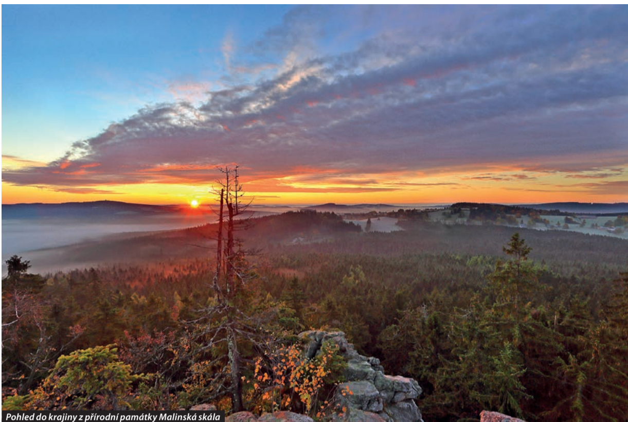
Pohled do krajiny z přírodní památky Malinská skála